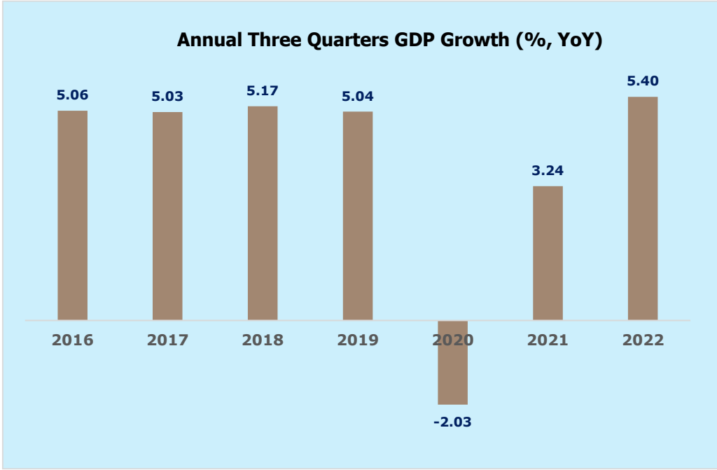
Chart 3: After Quarters of Disruption, Back to Normal 5's% Level