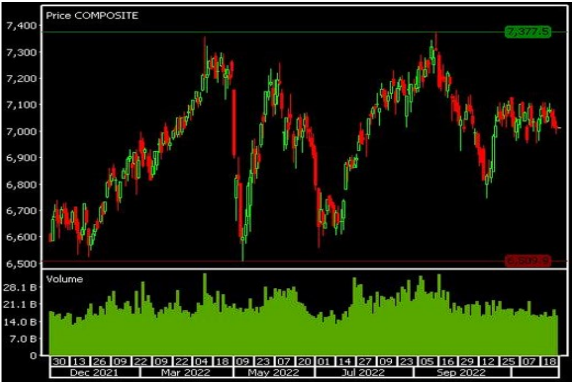
Chart 4: It Takes Growths for the JCI for An Orderly Tango